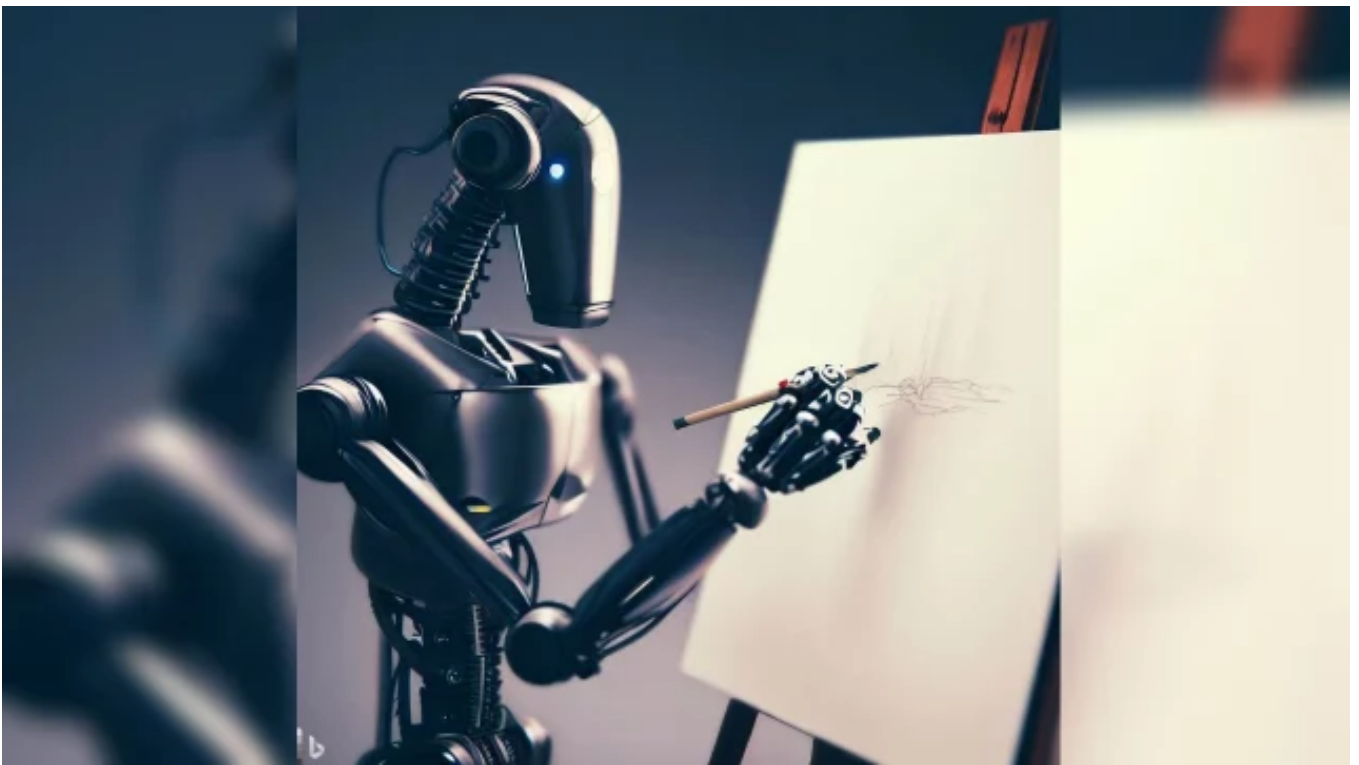
Imagen creada con Bing Image Creator.

ChatGPT no ha dejado de acaparar las conversaciones sobre tecnología. La gente ha comenzado a adoptar el chatbot como una nueva herramienta para realizar su trabajo. No solo programadores, desarrolladores de software o perfiles asociados al sector puramente tecnológico, también profesores, sociólogos, músicos, creativos, diseñadores, por mencionar algunos ejemplos.